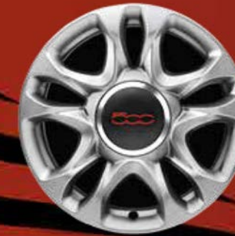
15"-LEICHTMETALLFELGEN 5 Speichen, silber (SPORT)