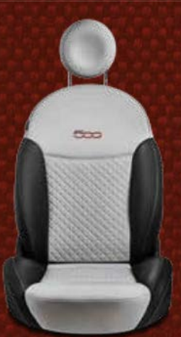
Gesteppte Stoffsitze in White Sand mit Details aus Vinyl. Eingesticktes 500-Logo in Bordeauxrot.