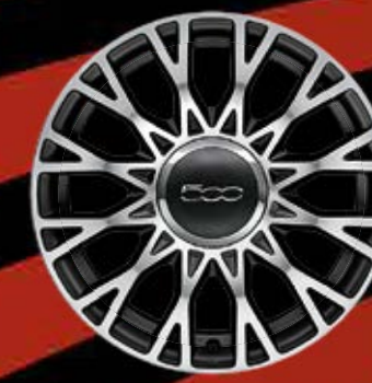
16"-LEICHTMETALLFELGEN 12 Doppelspeichen in Diamantfinish (optional für STAR)