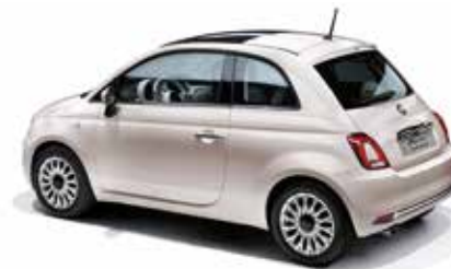
494 – EXKLUSIV FÜR AUSSTATTUNGSLINIE STAR STELLA WEISS