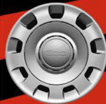
14"-RADZIERBLLENDE GRAU (POP)