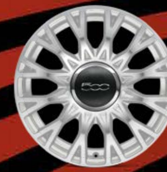
16"-LEICHTMETALLFELGEN 12 Doppelspeichen in Weiß (optional für STAR)