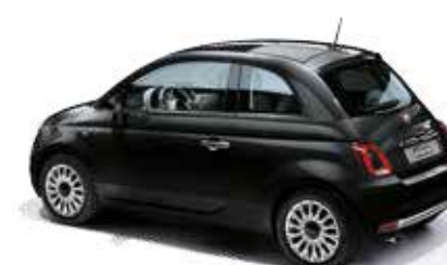
876 VESUVIO SCHWARZ