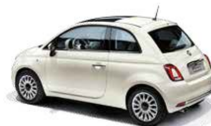
227 GHIACCIO WEISS