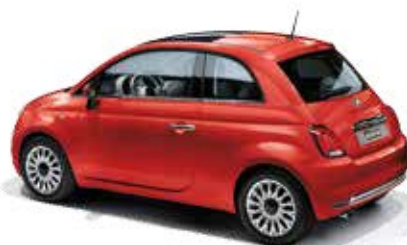
552 CORALLO ROT