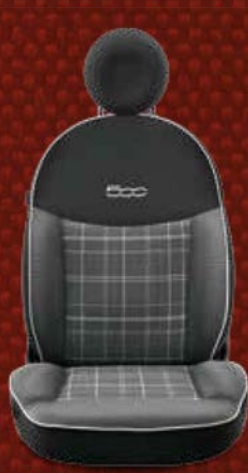
Stoff „Prince of Wales“ Karomuster Schwarz/Elfenbein mit schwarzen Seiten und Akzenten in Elfenbein. Kopfstütze und Einfassung serienmäßig mit Stoffbezug. Mit eingesticktem 500-Logo in der Kontrastfarbe Elfenbein.