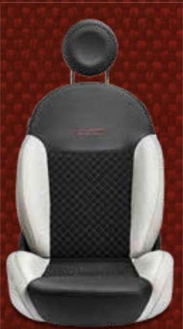
Gesteppte Stoffsitze in Schwarz mit Details aus Vinyl. Eingesticktes 500-Logo in Bordeauxrot.