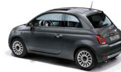
695 POMPEI GRAU