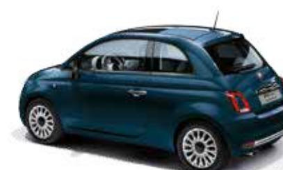
687 DIPINTO DI BLU BLAU