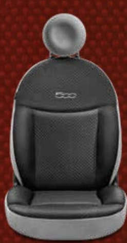
Stoff „Chevron“ in Schwarz (Sitz/Rückenlehne) mit Seiten und Kopfstützen aus grauem Stoff. 500-Logo in grauer Thermodruckfolie.