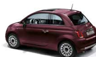
866 OPERA BORDEAUX