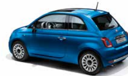
425 ITALIA BLAU