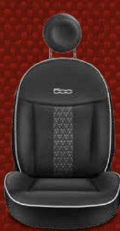
Schwarze Stoffsitze mit grauem Ethno-Tattoo-Muster mit Akzenten in Weiß und eingesticktem 500-Logo in Weiß.