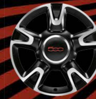
16"-LEICHTMETALLFELGEN 5 Speichen (optional für ROCKSTAR)