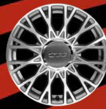
16"-LEICHTMETALLFELGEN 12 Doppelspeichen (STAR)