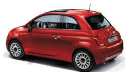
111 PASSIONE ROT