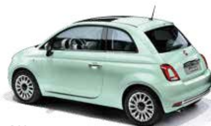
166 LATTEMENTA GRÜN