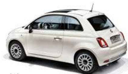
268 GELATO WEISS