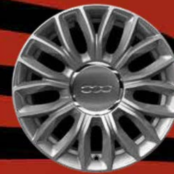
15"-LEICHTMETALLFELGEN 9 Speichen (optional für LOUNGE)