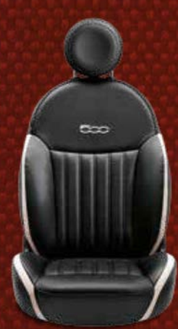
Schwarzes Leder* mit Einsätzen in Elfenbein. Eingesticktes 500-Logo in der Kontrastfarbe Elfenbein.