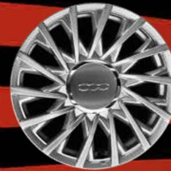
15"-LEICHTMETALLFELGEN 14 Doppelspeichen (LOUNGE)

Das beweisen die Felgen, die zur Auswahl stehen, damit Sie Ihren Fiat 500 mit Ihrer ganz persönlichen Note versehen können. Denn nach Perfektion muss nicht erst gesucht werden, sie ist schon erreicht. Und vielleicht sogar übertroffen.