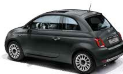
735 CARRARA GRAU