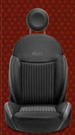
Schwarze Stoffsitze im Nadelstreifendesign mit Details in Vinyl und titaniumgrauen Einsätzen. Eingesticktes 500-Logo in Titaniumgrau.