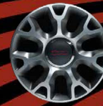
16"-LEICHTMETALLFELGEN 7 Speichen (ROCKSTAR)