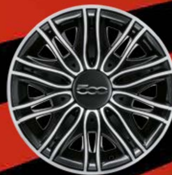
15"-DESIGNSTAHLFELGEN (optional für POP)