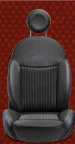
Schwarze Stoffsitze im Nadelstreifendesign mit Details in Vinyl und blauen Einsätzen. Eingesticktes 500-Logo in Blau.