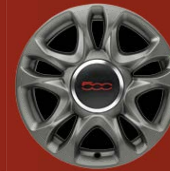
15"-LEICHTMETALLFELGEN 5 Speichen, dunkel satiniert (optional für SPORT)