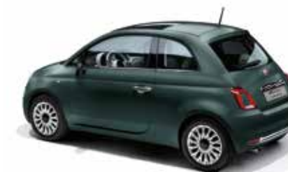
421 – EXKLUSIV FÜR AUSSTATTUNGSLINIE ROCKSTAR PORTOFINO GRÜN