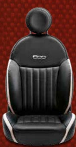
Schwarzes Leder* mit Einsätzen in Elfenbein. Eingesticktes 500-Logo in der Kontrastfarbe Elfenbein.