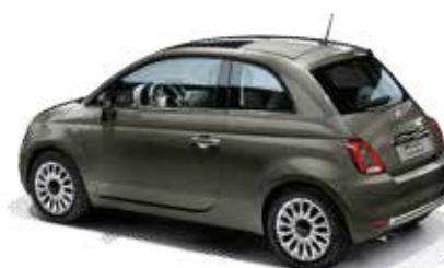
372 COLOSSEO GRAU