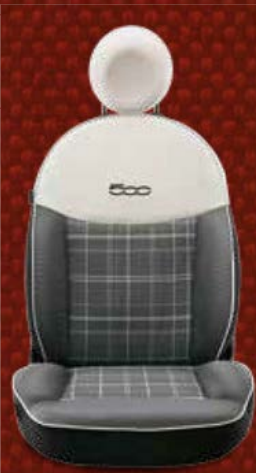
Stoff „Prince of Wales“ Karomuster Schwarz/Elfenbein mit schwarzen Seiten und Akzenten in Elfenbein. Kopfstütze und Einfassung serienmäßig mit Stoffbezug / optional in Eco-Leder* (Lounge Pack 05F). Mit eingesticktem 500-Logo in der Kontrastfarbe Schwarz.