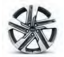
19-Zoll-Leichtmetallfelgen (für Spirit Diesel und ab Vision Hybrid)