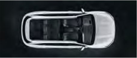
3. Reihe teilweise umgeklappt

Ganz gleich, ob mehr Platz für Passagiere oder für Gepäck benötigt wird – wenn es um Flexibilität geht, ist der neue Kia Sorento in seinem Element. Die dritte Sitzreihe*, die den SUV zum Siebensitzer macht, lässt sich leicht ein- und ausklappen. Der großzügige Gepäckraum fasst bei fünf Sitzen je nach Ausführung bis zu 910 Liter. Und falls das mal nicht ausreicht, kann die zweite Sitzreihe vom Gepäckabteil aus per Fernentriegelung teilweise oder ganz umgeklappt werden.