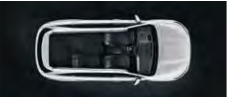
3. Reihe voll und 2. Reihe teilweise umgeklappt