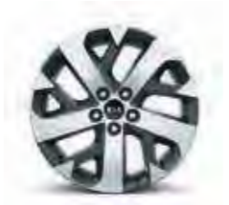
18-Zoll-Leichtmetallfelgen (für Vision Diesel)