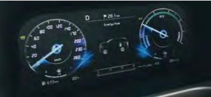
DIGITALES KOMBIINSTRUMENT (31,2 CM / 12,3 ZOLL)

Kia Sorento 1.6 T-GDI Hybrid AWD AT: Kraftstoffverbrauch (l/100 km) innerorts 6,3; außerorts 6,1; kombiniert 6,2. CO 2 -Emission kombiniert (g/km): 141; Effizienzklasse: A.