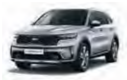
Seidensilber Metallic (4SS)