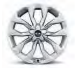
20-Zoll-Leichtmetallfelgen (für Platinum Diesel)