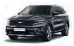
Graphite Metallic (ABT)