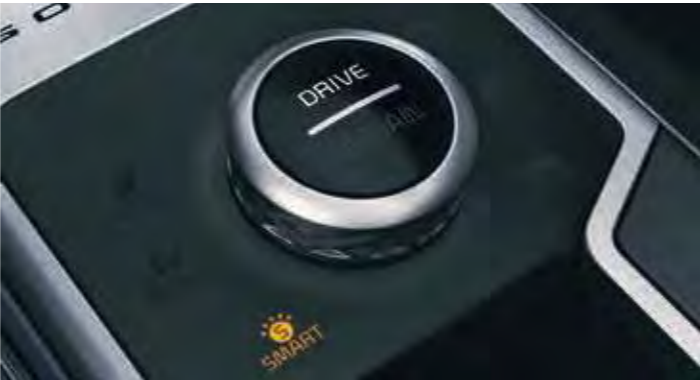
DRIVE MODE SELECT

Mit den serienmäßigen Schaltwippen in edlem Chrom-Design lassen sich die Automatik- und Doppelkupplungsgetriebe des neuen Kia Sorento manuell betätigen, ohne die Hand vom Lenkrad zu nehmen. Damit ermöglichen sie zugleich ein besonders dynamisches Fahrerlebnis bei voller Kontrolle.