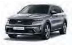
Stahlgrau Metallic (KLG)