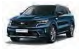
Gravity Blau Metallic (B4U)