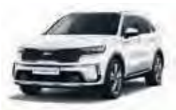
Snow White Pearl (SWP), nur für Spirit und Platinum