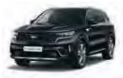
Auroraschwarz Metallic (ABP)