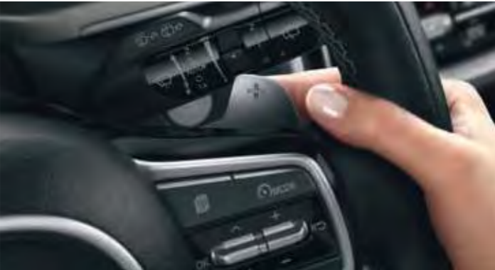
SCHALTWIPPEN AM LENKRAD

Für den Antrieb stehen beim neuen Kia Sorento ein 1,6-Liter-Turbobenziner mit Hybrid-System und ein moderner 2,2-Liter-Turbodiesel zur Wahl. Der 1.6 T-GDI Hybrid verfügt serienmäßig über eine Sechs-Stufen-Automatik, der 2.2 CRDi über ein achtstufiges Doppelkupplungsgetriebe. Beide Motorisierungen sind mit Front- und Allradantrieb sowie als Fünf- und Siebensitzer* erhältlich.