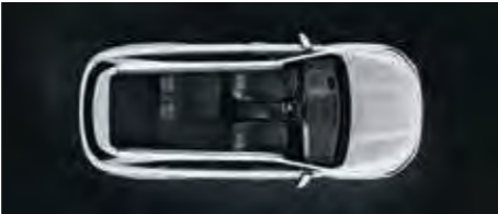
2. Reihe teilweise umgeklappt (Fünfsitzer)

Was auch immer Sie planen oder transportieren möchten: Der neue Kia Sorento ist auf alles vorbereitet.