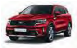
Runwayrot Metallic (CR5)