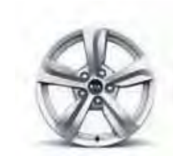
17-Zoll-Leichtmetallfelgen (für Edition 7 Diesel)