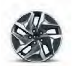
17-Zoll-Leichtmetallfelgen (für Edition 7 Hybrid)