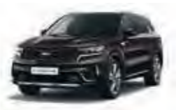
Essencebraun Metallic (BE2)