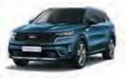
Mineralblau Metallic (M4B)