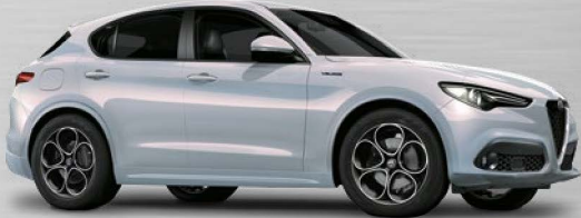
252 Perla Lunare

• mögliche Kombination - nicht erhältlich