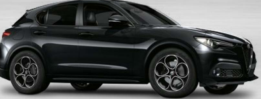
408 Nero Vulcano