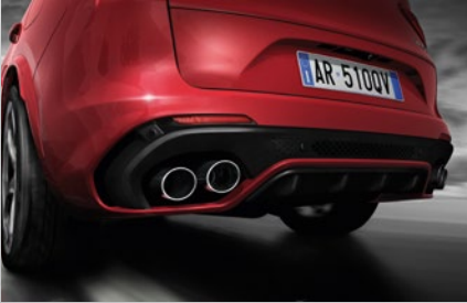
Stoßfänger hinten im Quadrifoglio-Design, Sport-Abgasanlage 4-flutig