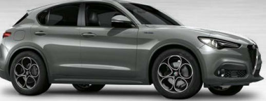
318 Grigio Stromboli