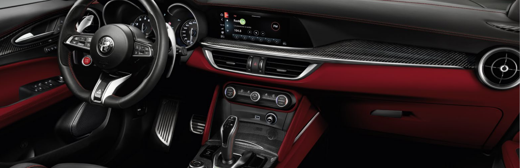
Sportsitze in Leder/Alcantara® QUADRIFOGLIO: Nero mit roten Nähten. Armaturentafel und Türverkleidungen: Nero-Rosso.