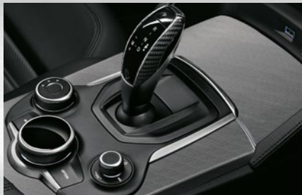
Abdeckung für den Schaltknäuf, aus Kohlefaser