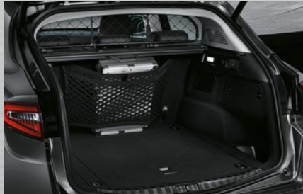
Gepäcknetz an der Rücksitzbank und Faltbox für den Kofferraum