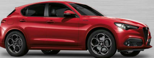
361 Rosso Competizione