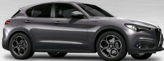
035 Grigio Vesuvio