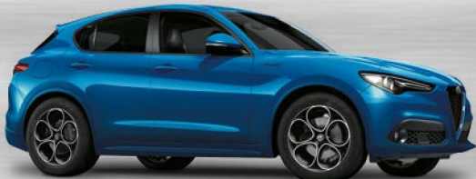
756 Blu Misano