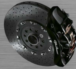
Bremssättel schwarz lackiert mit Alfa Romeo Schriftzug