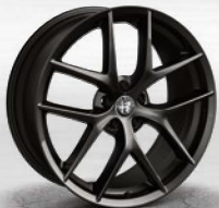
TROFEO, dunkel lackiert