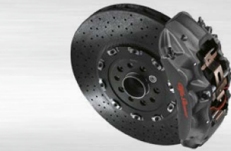
Bremssättel eloxiert mit Alfa Romeo Schriftzug