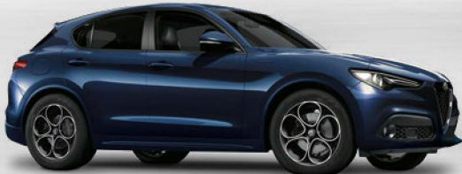
092 Blu Montecarlo