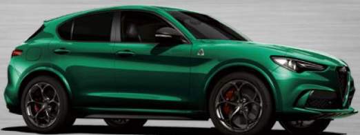
646 Verde Montreal

Die gezeigten Farben können aus drucktechnischen Gründen von den Originalfarben abweichen. Bilder zeigen Sonderausstattung. Alle Preise sind unverbindliche Preisempfehlungen des Herstellers ab Werk (inkl. 16 % MwSt.). Gültig bis auf Widerruf, spätestens bis zum 31.12.2020.