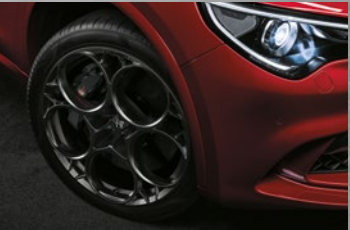
PROTOTIPO, dunkel lackiert