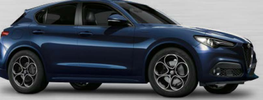
092 Blu Montecarlo