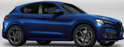
486 Blu Anodizzato