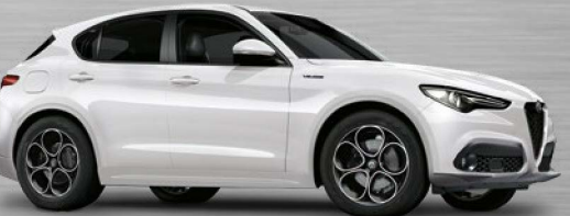
248 Bianco Trofeo