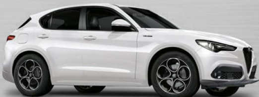
248 Bianco Trofeo