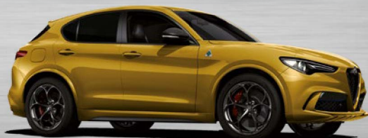
437 Ocra GT Junior