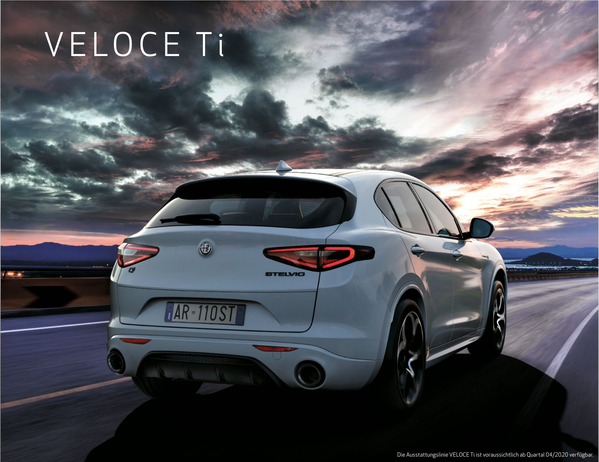
Die Ausstattungslinie VELOCE Ti ist voraussichtlich ab Quartal 04/2020 verfügbar.