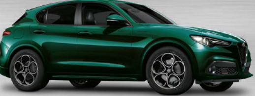
800 Verde Visconti