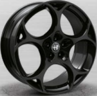
TURISMO, dunkel lackiert