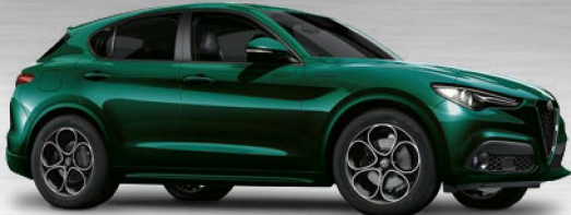
800 Verde Visconti