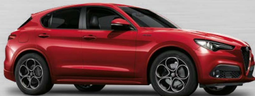
361 Rosso Competizione