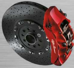
Bremssättel rot lackiert mit Alfa Romeo Schriftzug