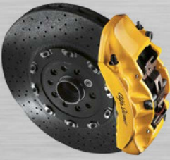
Bremssättel gelb lackiert mit Alfa Romeo Schriftzug