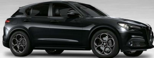
408 Nero Vulcano