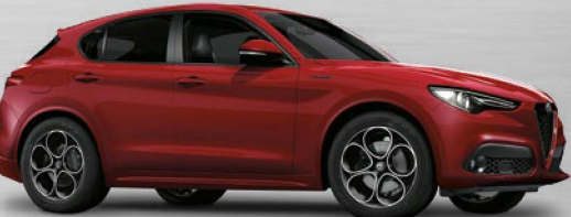
414 Rosso Alfa