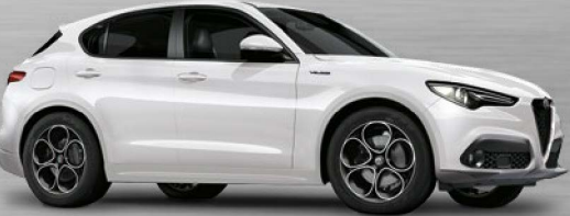
217 Bianco Alfa