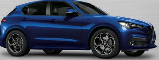
486 Blu Anodizzato