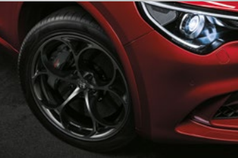
CLASSICO, dunkel lackiert