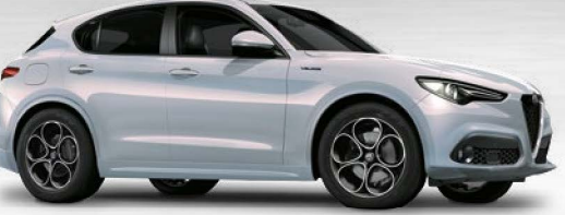
252 Perla Lunare