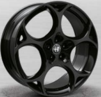
TURISMO, dunkel lackiert