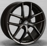
TROFEO, dunkel lackiert