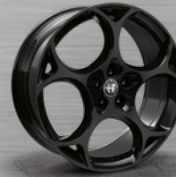
TURISMO, dunkel lackiert