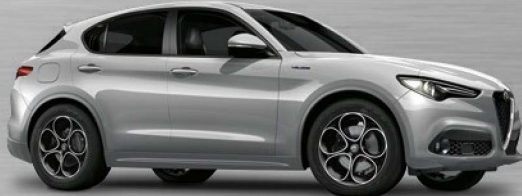
620 Grigio Silverstone