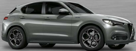
318 Grigio Stromboli