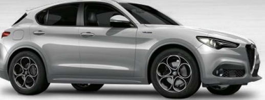
620 Grigio Silverstone