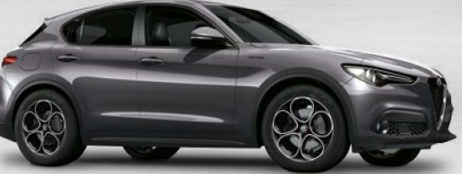
035 Grigio Vesuvio